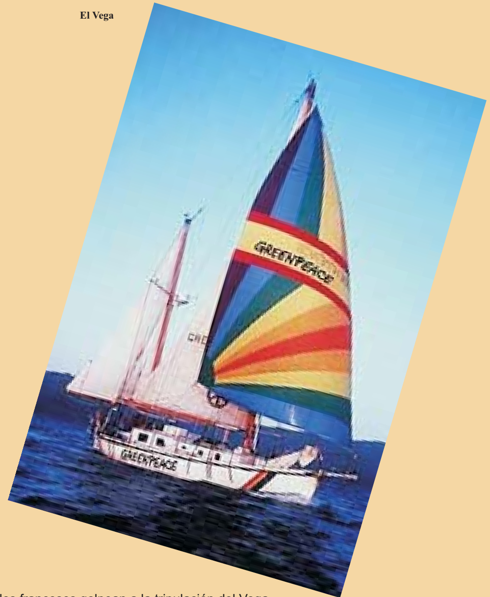
Comandos franceses golpean a la tripulación del Vega. GP