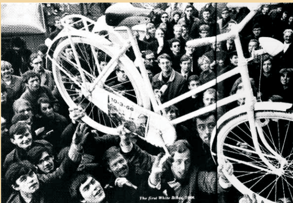
lanzamiento de la primera bicicleta blanca en Amsterdam

El periodo de los sesenta y comienzos de los setenta correspondió a una sociedad con una juventud altamente comprometida, con muchas ganas de cambiar el mundo y con la voluntad de sumar el personal compromiso en esta tarea, una juventud que sentía que todo lo que querían hacer era posible. En el Amsterdam de los años sesenta, rebotante de ideas libertarias alimentadas por provos revolucionarios, hippies inconformistas y