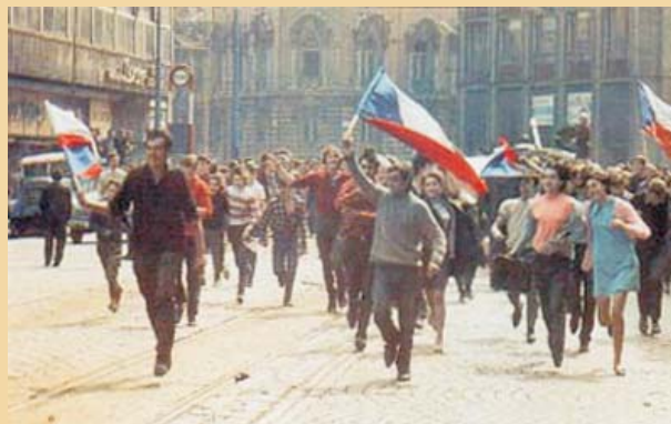
Un grupo de jóvenes celebran en la Plaza de San Wenceslao en Praga el inicio de reformas políticas en su país en abril de 1968.

Los jóvenes congregados en la Plaza de San Wenceslao en Praga llevan rostros alegres, un paso rápido y decidido que parecen mostrar un deseo por alcanzar las medidas reformistas aprobadas y disfrutar de la incipiente libertad política, económica, cultural, y religiosa.