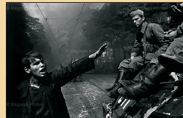
Un joven checoslovaco desarmado se dirige a soldados de las fuerzas de ocupación del Pacto de Varsovia en agosto de 1968.

Cuatro meses después esta imagen pasará a la historia, y la Plaza de San Wenceslao será el trágico escenario de la invasión militar de Las tropas del Pacto de Varsovia y del posterior suicidio de un joven estudiante, Jan Palach, quien había visto frustrados en su país sus anhelos de libertad.